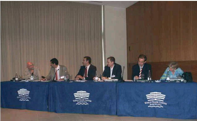
FIGURA 3 La “mesa redonda” en un determinado momento...