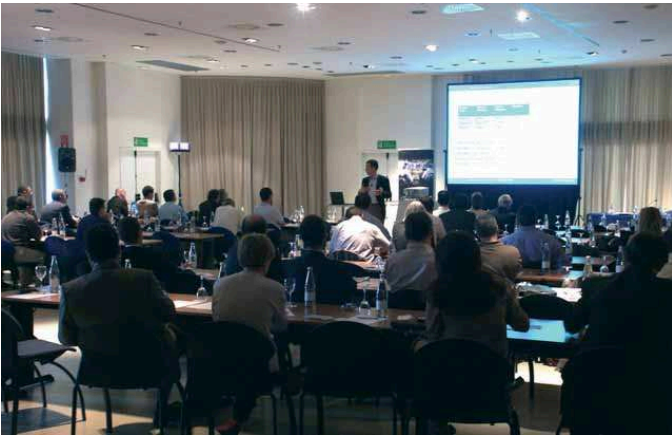
FIGURA 2 Una instantánea de la reunión “Encuentros i5” (en Barcelona)